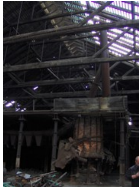
Nekdanja separacija v Banski Štiavnici