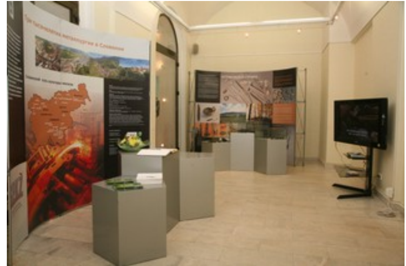
Razstava Tritisočletja železarstva na Slovenskem v Politehniškem muzeju v Moskvi