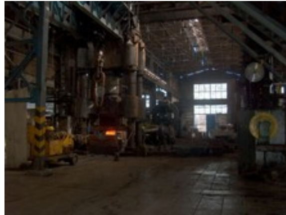
Železarna v Miškolcu