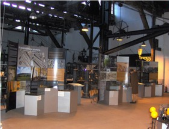
Razstava Tritisočletja železarstva na Slovenskem v Madžarskem livarskem muzeju v Budimpešti