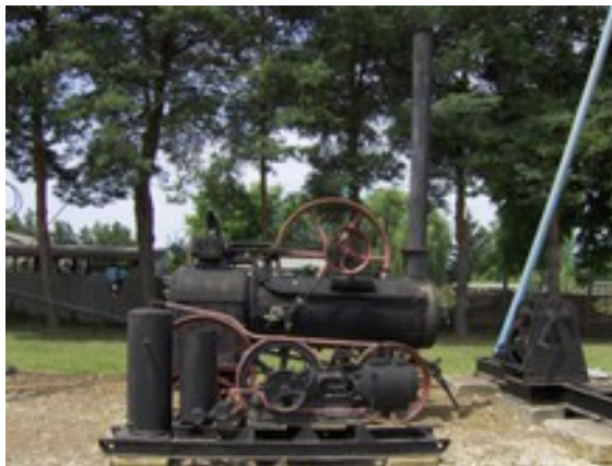
V Madžarskem naftnem muzeju, Zalaegerszeg

Madžarska industrijska pot vključuje poti različnih industrijskih panog, med njimi je Pot železa