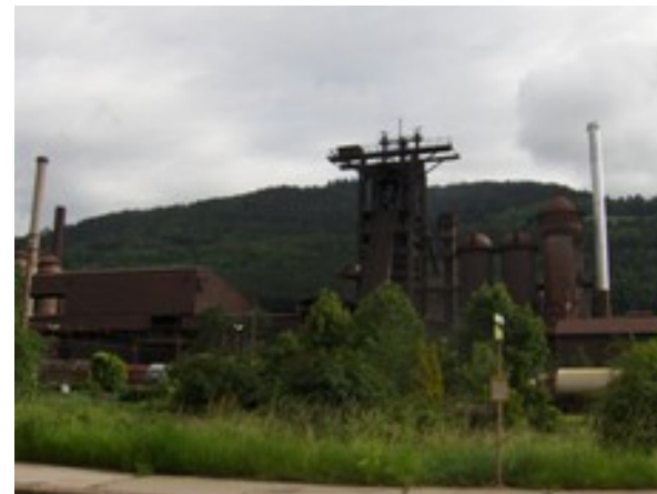
Železarna v Leobnu

V Avstriji imajo Železno pot v deželah: Štajerska, Nižja Avstrija in Gornja Avstrija