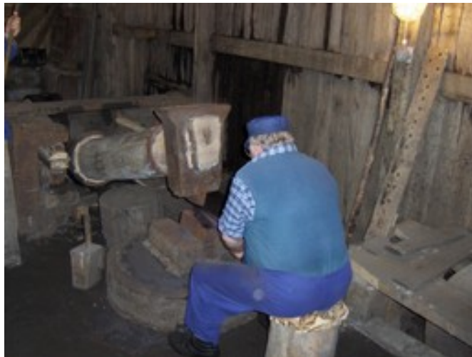
Ohranjena fužina v Medzevu