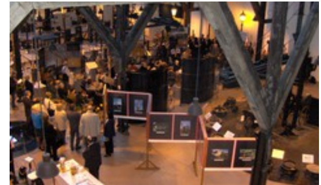
V Madžarskem livarskem muzeju v Budimpešti