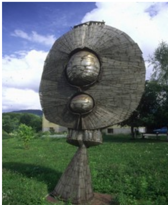
Jeklena skulptura Forma viva, Slavko Tihec, 1964