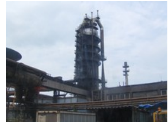
Železarna v Košicach